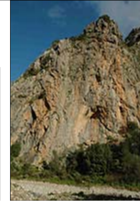
La Cimera / Sector Hörguç