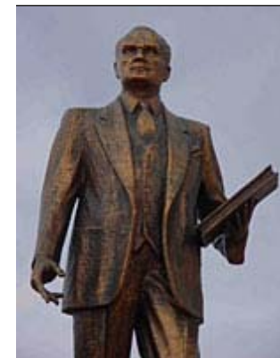
Hagia Sophia in Istanbul / el líder Mustafa Kemal Atatürk