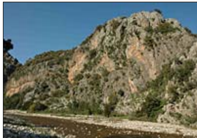
Sectores de Cirali